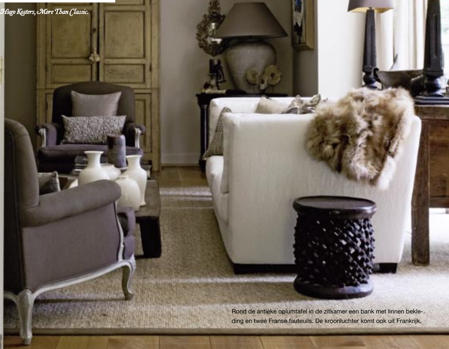
Rond de antieke opiumtafel in de zitkamer een bank met linnen bekleding en twee Franse fauteuils. De kroonluchter komt ook uit Frankrijk.

Productie: Hugo Kesters, More Than Classic.