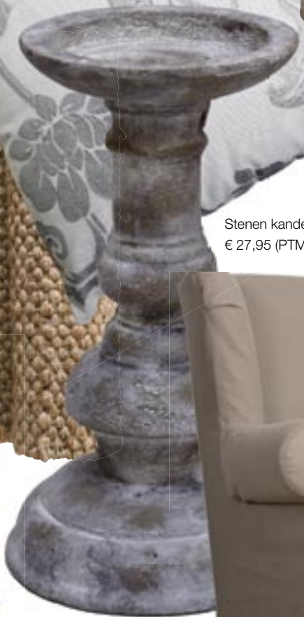
Stenen kandelaar € 27,95 (PTMD).