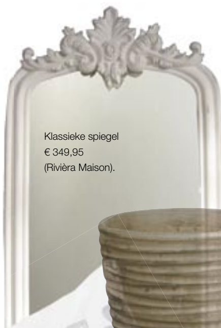
Klassieke spiegel € 349,95 (Rivièra Maison).