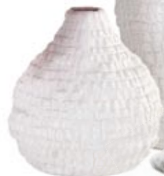
Vaasjes van wit keramiek met reliëf € 3,95 en € 4,95 (Trendhopper).