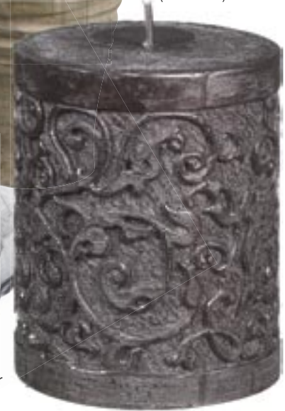
Grote stompkaars met reliëf € 7,90 (Sia Home).