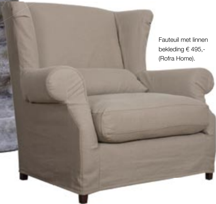
Fauteuil met linnen bekleding € 495,- (Rofra Home).